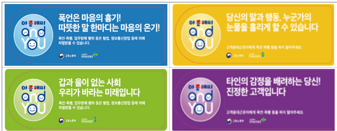
[그림 3] 고용노동부 폭언·폭행 예방 스티커