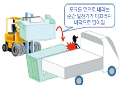
[ 적재함 문을 닫던 중 떨어진 발전기와 적재함 사이에 끼임 ]