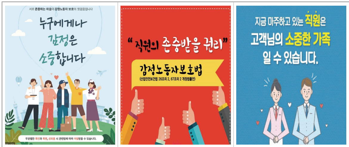
[그림 2] 감정노동 캠페인