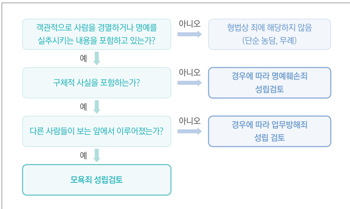
〔그림 1〕 욕설 등을 하는 경우 성립할 수 있는 범죄

1) 폭언, 폭행, 그 밖에 적정 범위를 벗어난 행위의 의미는 욕설, 모욕, 괴롭힘 등의 행위 외에 성적 수치심, 굴욕감을 느끼게 하는 행위 등을 말한다. 이러한 행위는 인간의 존엄성과 가치, 노동인격을 실현하는 모든 행위로 이해한다. 출처 : 이상국(2019). 개정 2판 판례행정해석 산업안전보건법( I ), 대명출판사