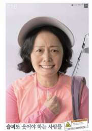
슬퍼도 웃어야 하는 사람들